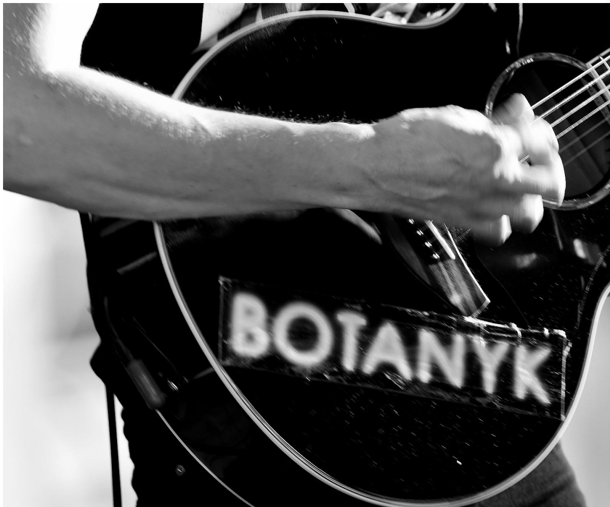
Léto plné hudby 2018