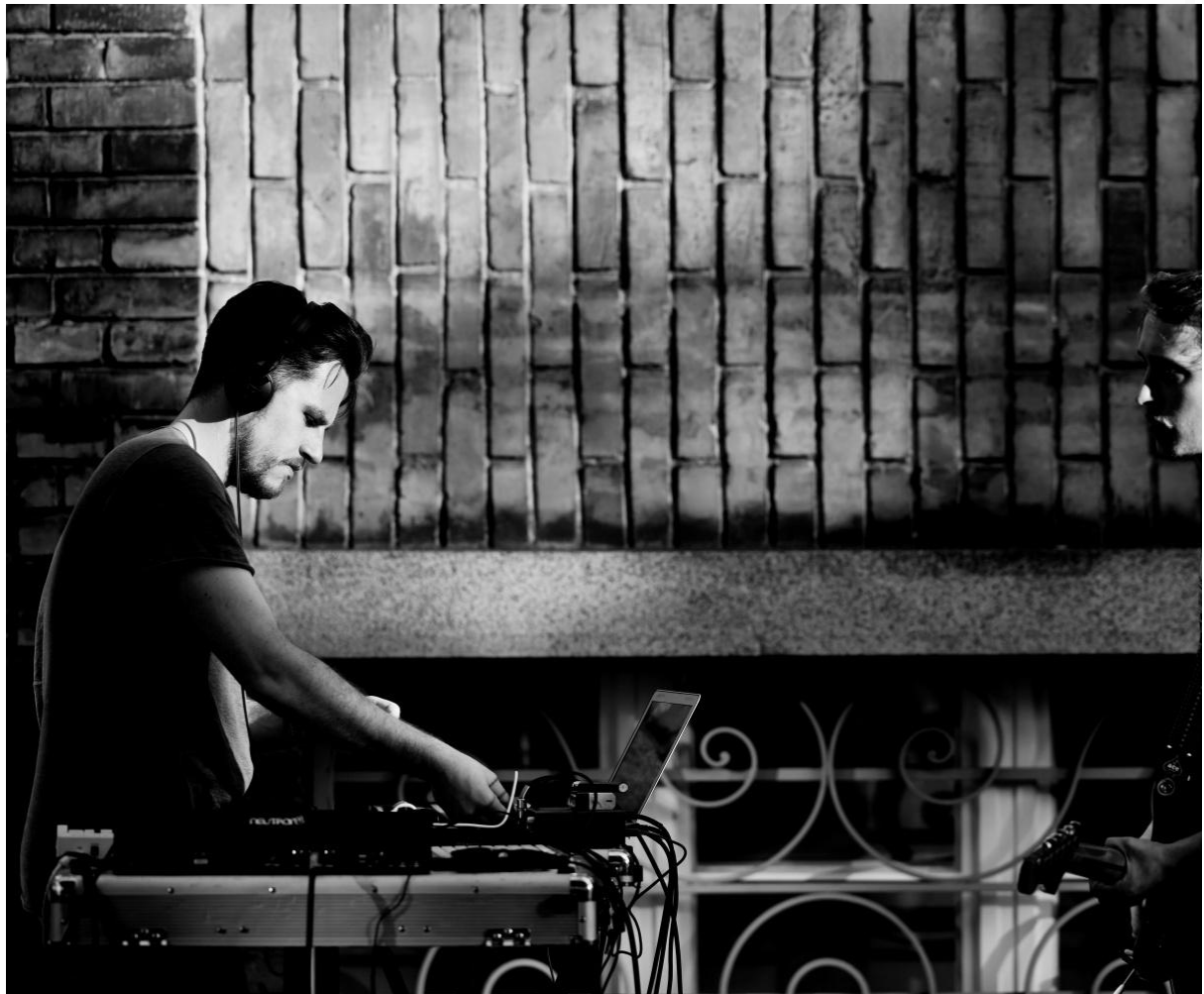
Léto plné hudby 2020