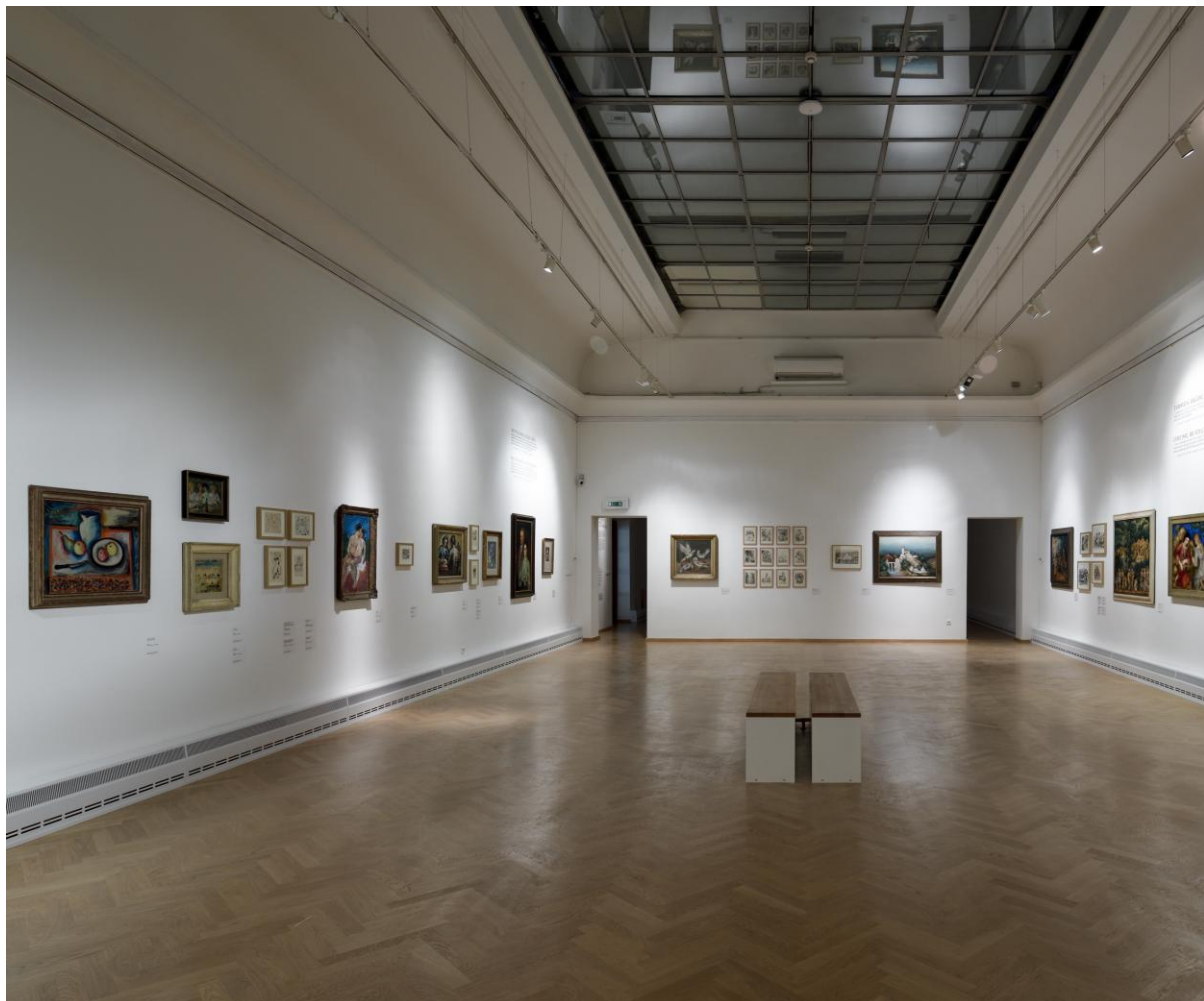
Foto: Náhled do výstavy Čarodějné laboratoř Antonína Procházky