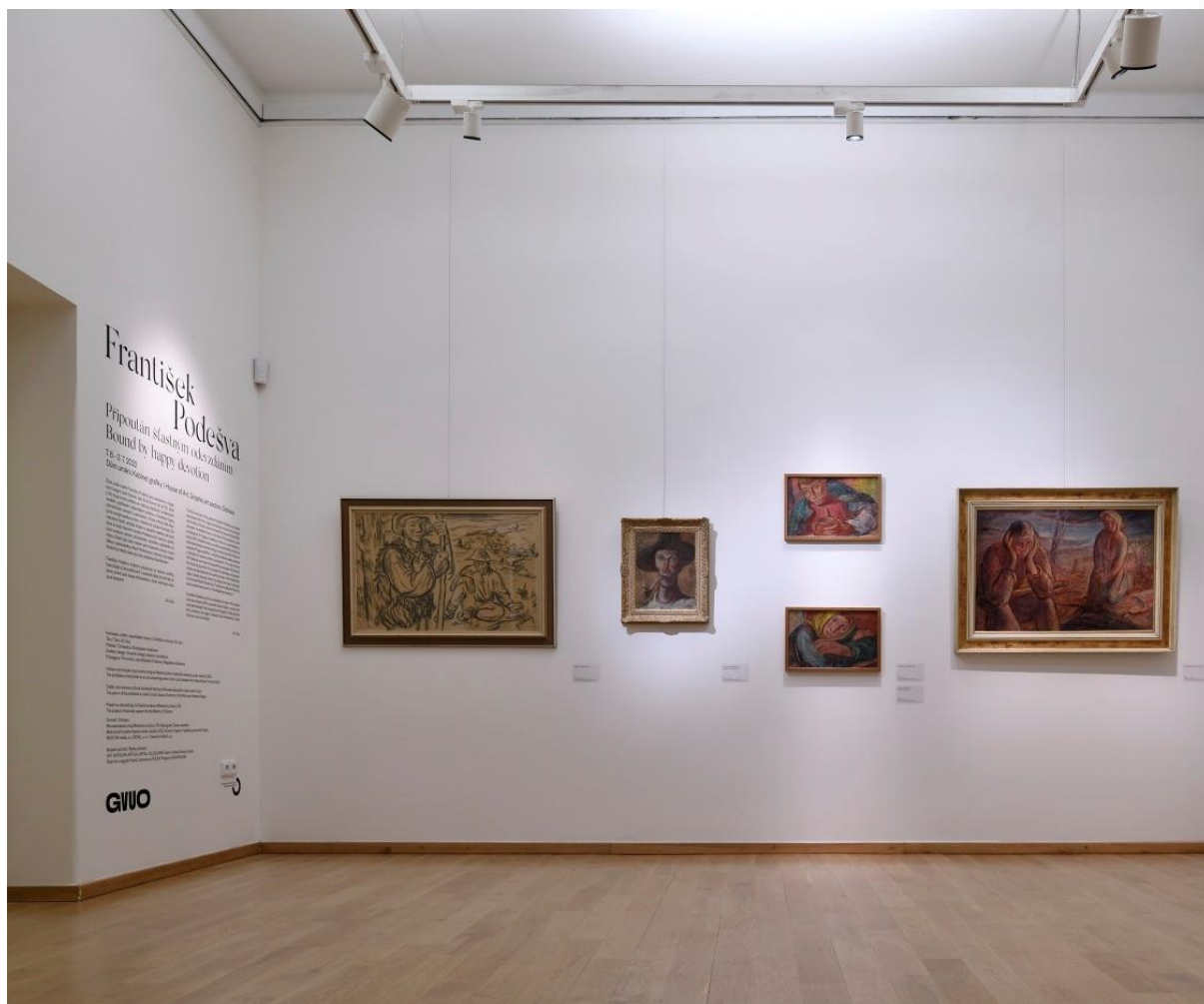
Foto: Náhled do výstavy FRANTIŠEK PODEŠVA / Připoután šťastným odevzdáním

Výstava se koná jako doprovodný program Mezinárodního hudebního festivalu Leoše Janáčka .