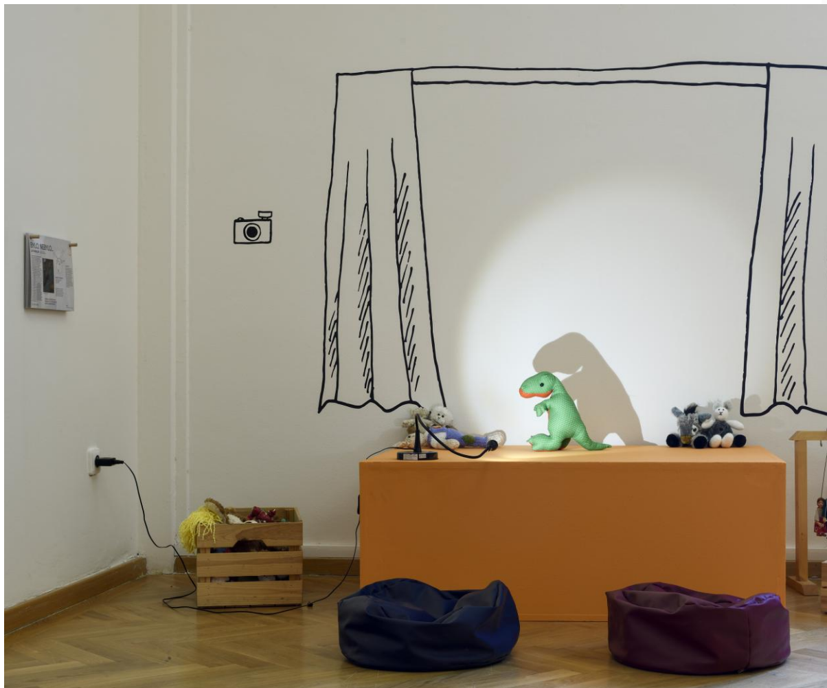
Foto: Náhled do výstavy Bylo, nebylo...