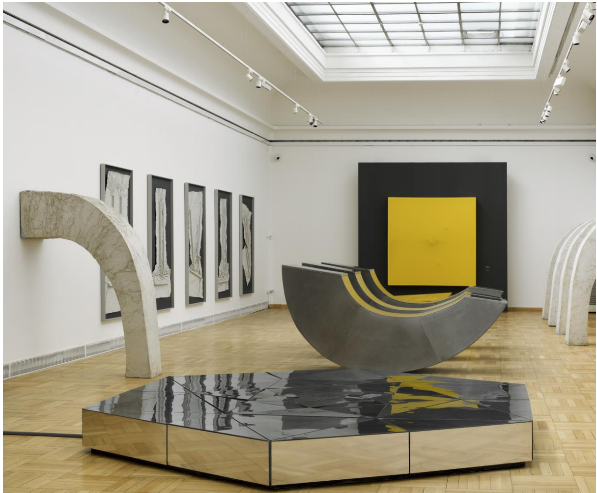
Foto: Náhled do výstavy ADÉLA MATASOVÁ / Mezičas, foto Roman Poláček