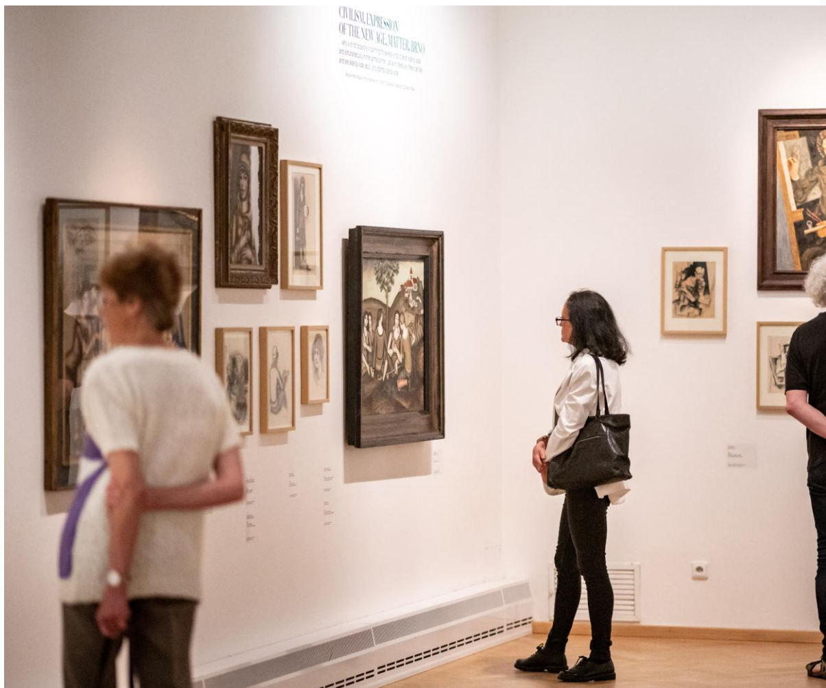
Foto: Náhled do výstavy Čarodějná laboratoř Antonína Procházky